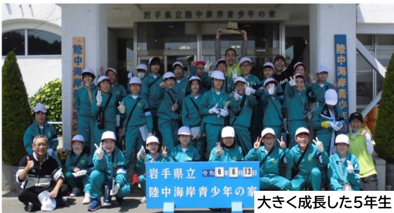
大きく成長した5年生